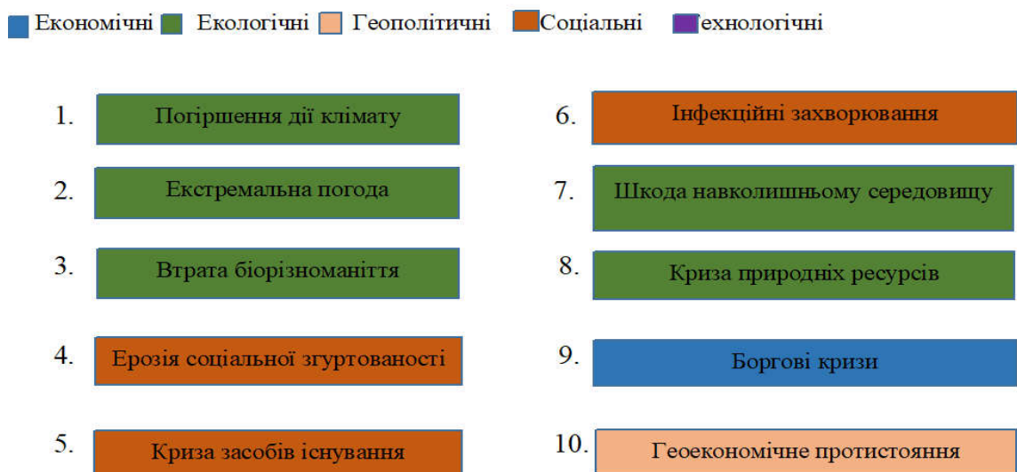
Рис. 1. Основні ризики на наступні 10 років [2]

Підтвердженням цього є визначені у Звіті Світового економічного форуму 2022 глобальні ризики, які будуть актуальними наступні 10 років (рисунок 1).