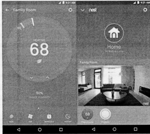
Рисунок 3 - Мобільний додаток Nest

Мобільний додаток Nest володіє наступними особливостями [2]: