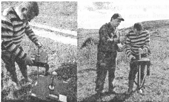
Рисунок 1 – Процедура проведення дослідження методом ПЕМПЗ на ділянці газопроводу «Пасічна-Долина»:

В якості експрес-методу оцінки напружень в гірському масиві обрано метод реєстрації природного імпульсного електромагнітного поля Землі (ПЕМПЗ). Процедура проведення дослідження методом ПЕМПЗ на ділянці газопроводу показана на рисунку 1.