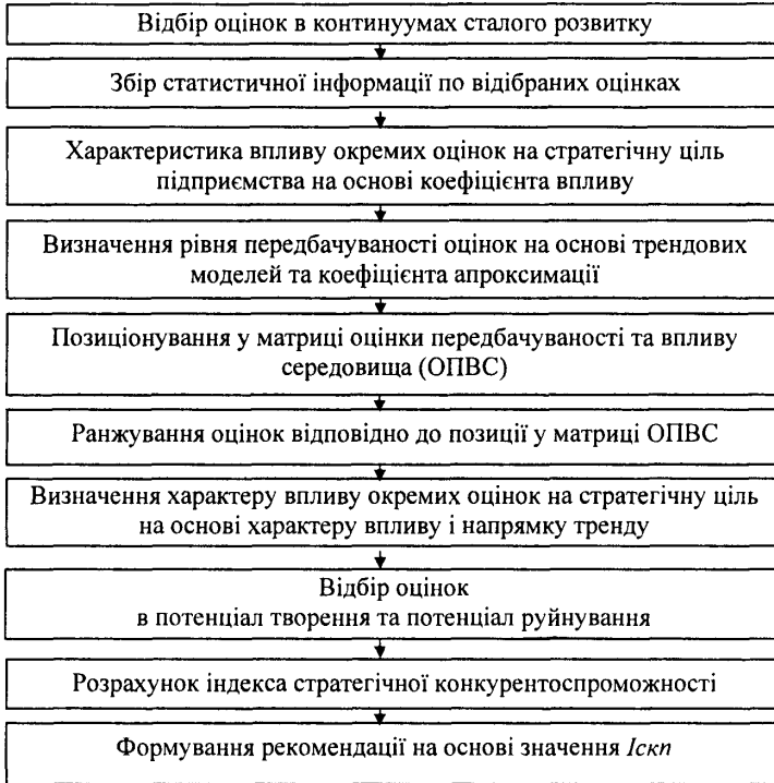
Рисунок 3 - Алгоритм розрахунку I_{scp} на основі економетричних досліджень

Розроблено алгоритм розрахунку індексу стратегічної конкурентоспроможності на основі економетричних досліджень, який представлений на рисунку 3.