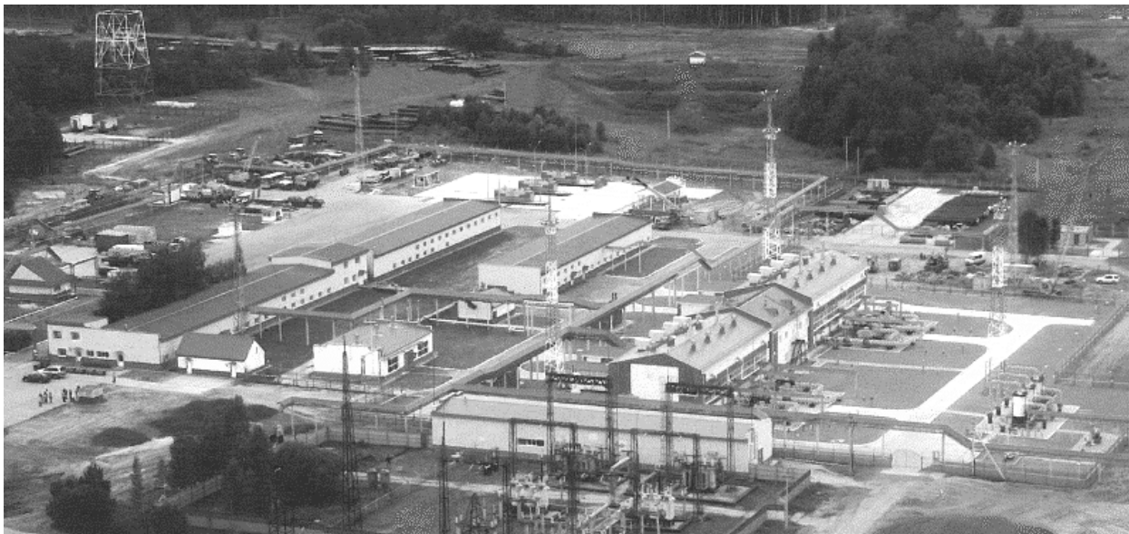
Рисунок 1 – Реконструкція електроприводних компресорних станцій. Газопровід ГПЗ – Парабель – Кузбас ТОВ «Газпром трансгаз Томск» КС Парабель

спортивного об'єднання і значно зменшити чисельність персоналу.