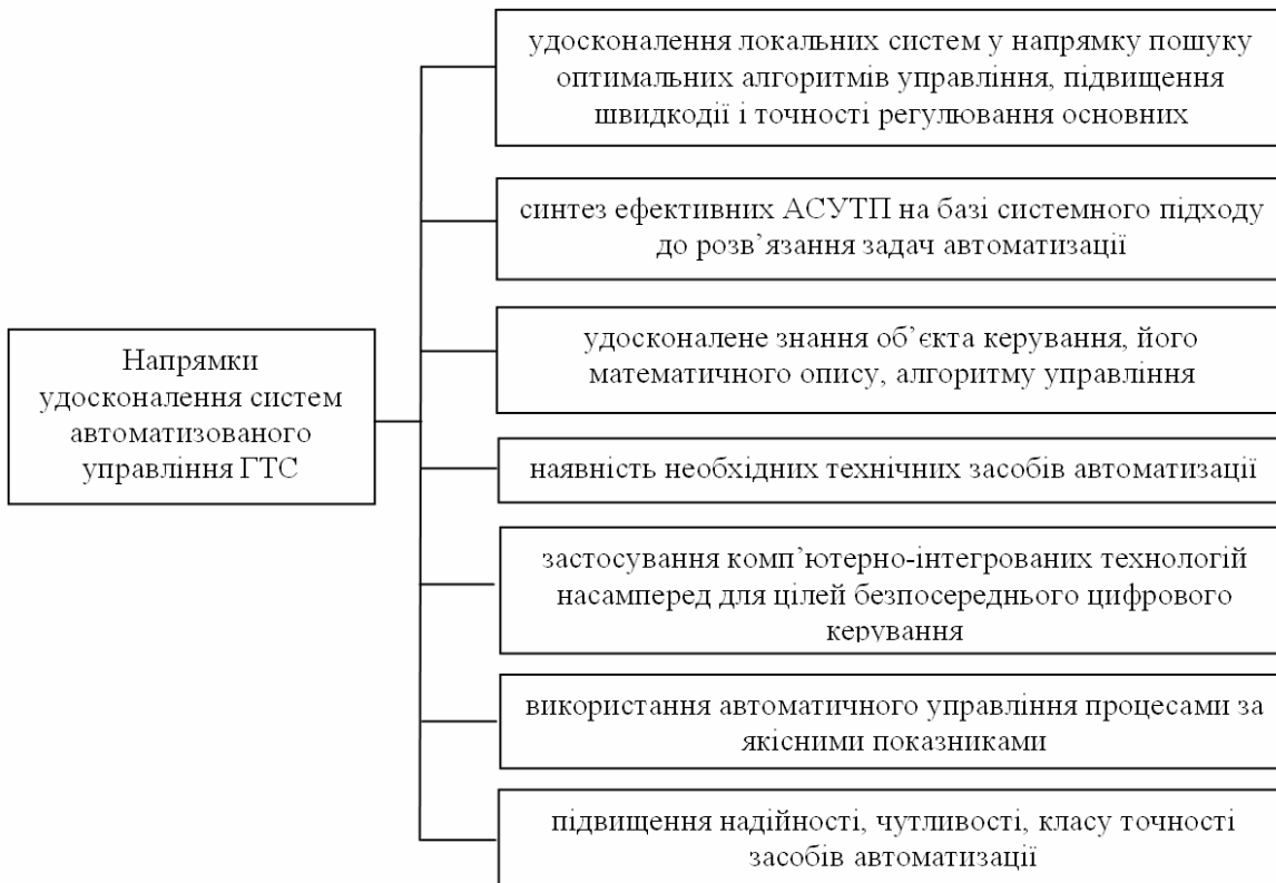
Рисунок 3 – Напрямки удосконалення систем автоматизованого управління ГТС