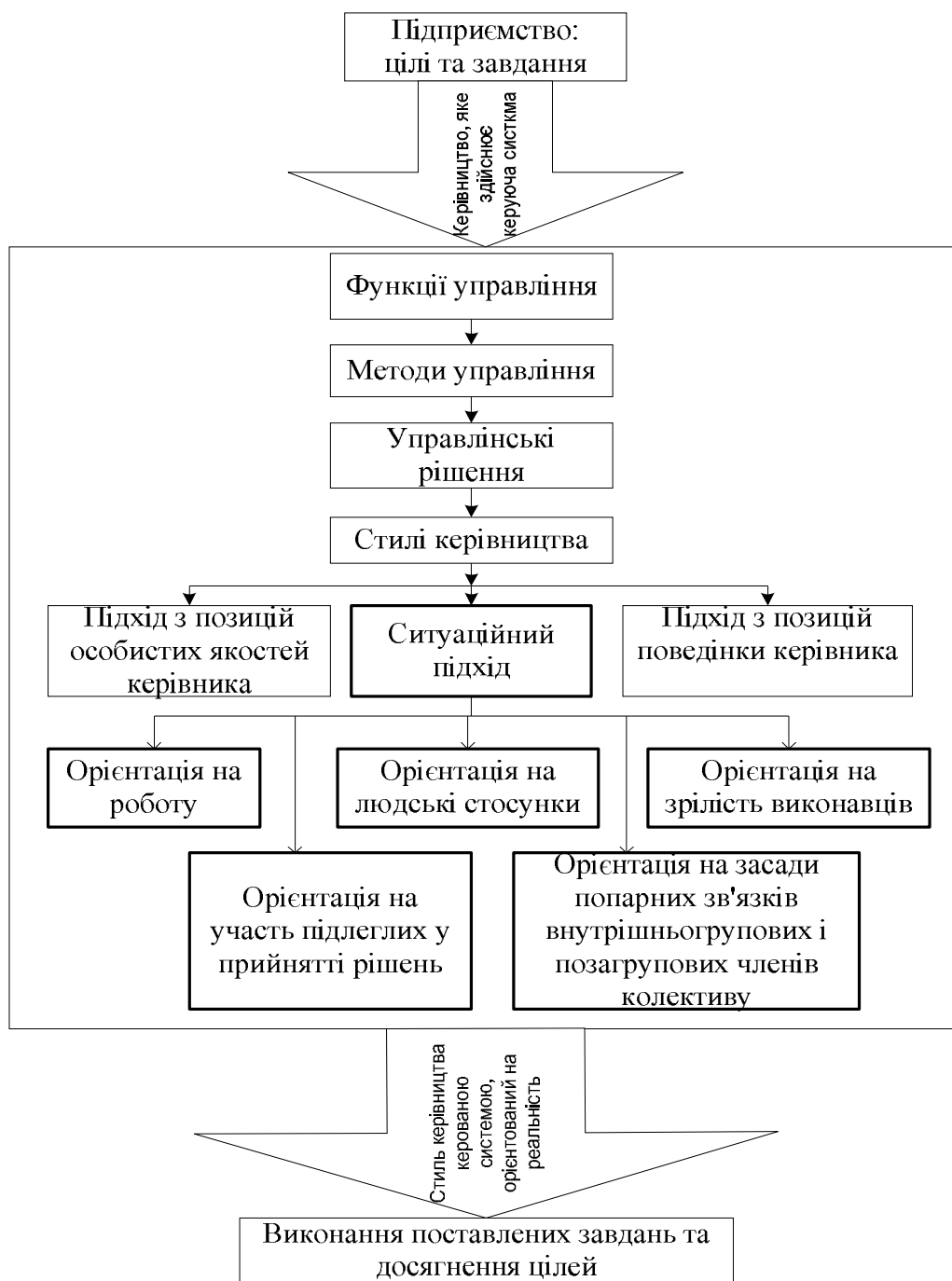
Рисунок 1 – Місце ситуаційного керівництва у процесі менеджменту на підприємстві (сформовано автором)

лості" працівників, яка охоплює мотивацію, компетентність і досвід.