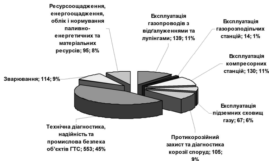
Рисунок 1 – Кількість НД у розділах (підрозділах) «Переліку», що відповідають основним напрямкам діяльності ДК «Укртрансгаз»

Як відомо надійна, безпечна та ефективна робота об'єктів магістральних газопроводів неможливе без наявності НД, які відповідають сучасному рівню науки і техніки та законодавчим вимогам. Зважаючи на це, ДК «Укртрансгаз» не тільки використовує НД національного та галузевого рівня приймання, а й активно розробляє потрібні НД цих рівнів. Нижче наведено приклади стратегічно-важливих нормативних документів, розроблених за участю фахівців ДК «Укртрансгаз» для потреб газотранспортної галузі України: