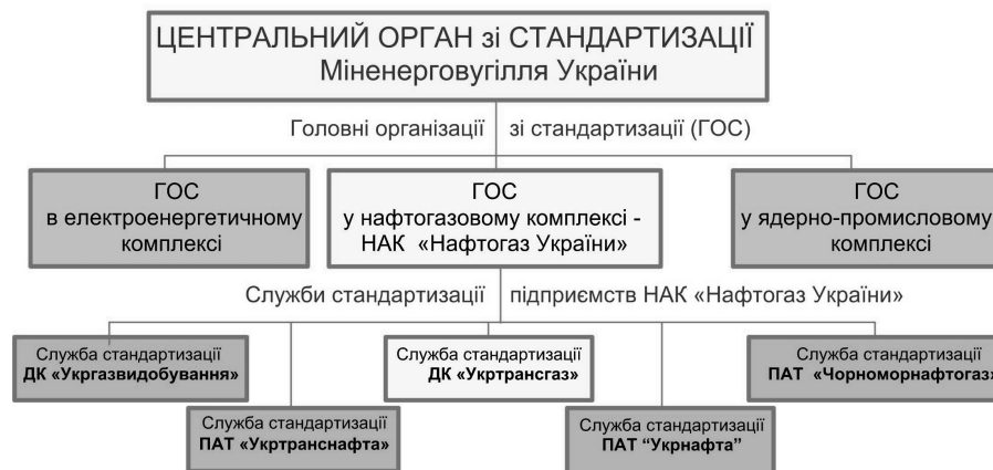
Рисунок 2 – Структура служби стандартизації Міненерговугілля України

Служба стандартизації ДК «Укртрансгаз» – це сукупність уповноважених структурних підрозділів Компанії та відповідальних осіб, яким надані функції з реалізації єдиної технічної політики Компанії у сфері стандартизації. Служба стандартизації ДК «Укртрансгаз» – це складник служби стандартизації Міненерговугілля України (рис. 2).