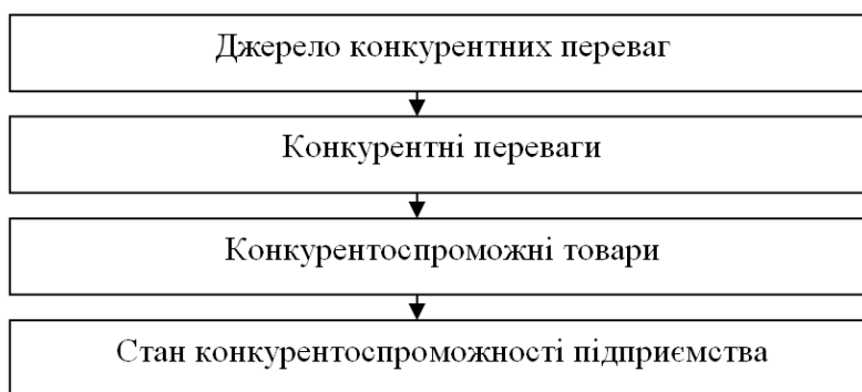
Рисунок 2 — Етапи досягнення стану конкурентоспроможності підприємства

3) обґрунтування і уточнення основних цілей та проведення маркетингового вивчення ринків;